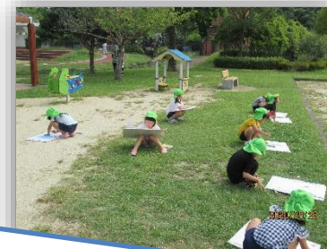
石炭記念公園にて...